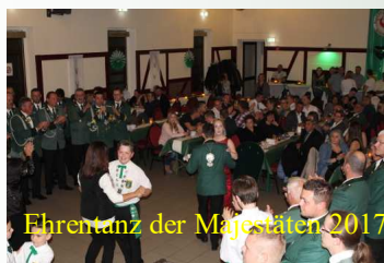
Ehrenanz der Majestäten 2017