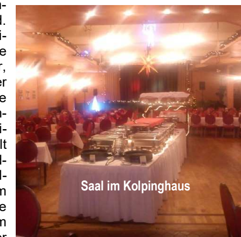
Saal im Kolpinghaus

Wir haben dort die Gelegenheit der Besichtigung des Gestüts und anschließend eine ca. 2 1/2-stündige Teilnahme an der Hengstparade. Der Fahrpreis beträgt für Aktive